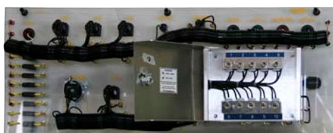
HV-1918-02 (vue arrière avec boîte de fautes ouverte)