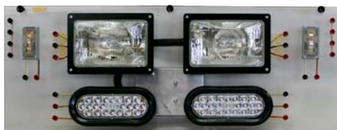
HV-1918-01 (vue de face)