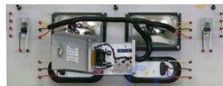
HV-1918-01 (vue arrière avec boîte de fautes ouverte)